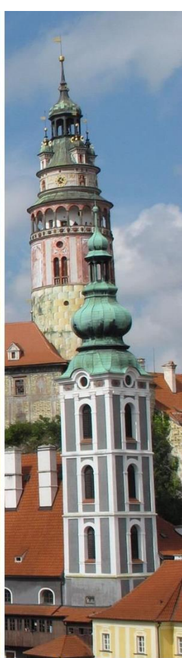
Franziskanisches Shalom-Kloster Puppung

Infos & Anmeldung: stefan.kitzmueller@franziskaner.at Tel.: +43 676 6245 808 puppung.franziskaner.at