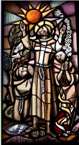
Glasfenster in San Damiano